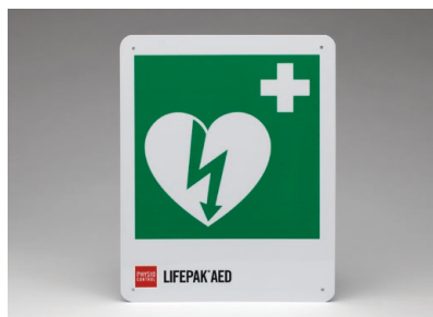
Pancarte à fixer indiquant l'emplacement d'un DAE (Comité ILCOR) 11998-000327 (avec logo, 20,3 x 25,4 cm)