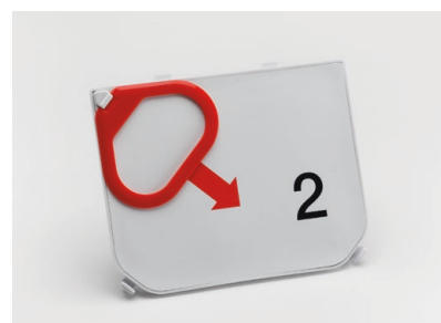
Électrode de rechange Couvercle du module 11250-000139