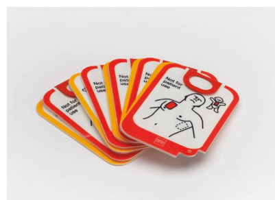
Jeu d'électrodes de formation Comprend 5 paires d'électrodes. 11250-000140