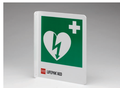
Pancarte à montage en T indiquant l'emplacement d'un DAE (Comité ILCOR) 11998-000328 (avec logo, 20,3 x 25,4 cm)