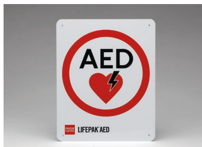
Pancarte à suspendre ou fixer indiquant l'emplacement d'un DAE 11998-000330 (avec logo, 20,3 x 25,4 cm)