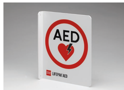
Pancarte à montage en T indiquant l'emplacement d'un DAE 11998-000331 (avec logo, 20,3 x 25,4 cm) 11998-000333 (sans logo, 20,3 x 25,4 cm)