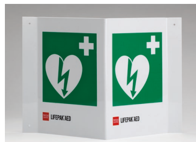
Pancarte à poser indiquant l'emplacement d'un DAE (Comité ILCOR) 11998-000329 (avec logo, 17,8 x 20,3 cm)