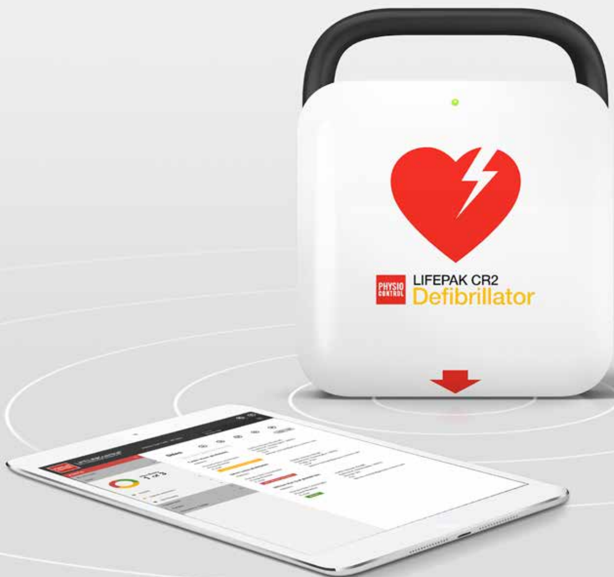
Défibrillateur LIFEPAK® CR2 Avec LIFELINKcentral™ , Outil de gestion DAE